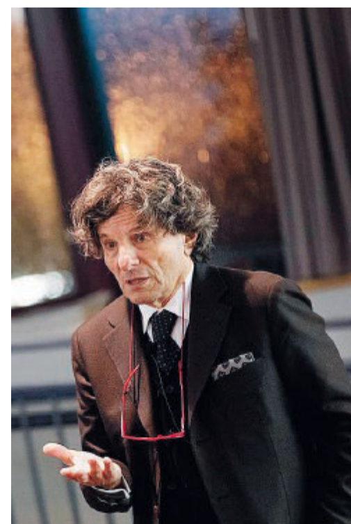
MANDURIA ESTATE Il filosofo Maurizio Viroli

La rassegna culturale estiva "In vino veritas. Stasera in compagnia di..." prevede la partecipazione di relatori che rappresentano figure di primo piano all'interno del panorama della vita sociale, in alcuni dei suoi aspetti caratteristici - dalla cultura, alla storia politica, all'arte - i quali vengono invitati a fornire un loro contributo al bisogno comune di tornare a pensare ad una progettualità del domani. Il programma completo di Manduria Estate è su www.popolaria.it .